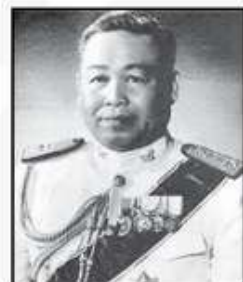
พลโท เผชญ นิมิบุตร ผู้อำนวยการ คนที่ 2 1 พ.ค.2503-1 พ.ย.2510